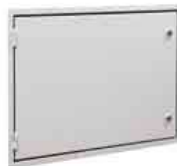
REGISTROS CORTAFUEGOS METAL