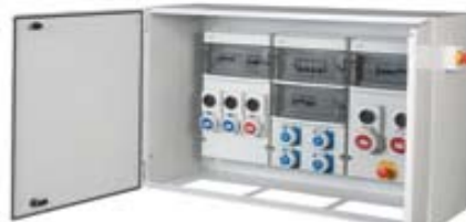
PLÁSTICOS SIN PROTECCIONES Y CON BASES TIPO SCHUKO

Todas las cajas están fabricadas con materiales plásticos de alta durabilidad libres de halógenos y con protección UV, se suministran con las bases montadas y cableadas.