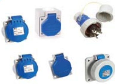
TIPO SCHUKO IP44- IP54- IP55- IP67