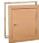
REGISTROS CORTAFUEGOS MADERA