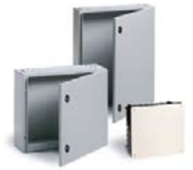
REGISTROS DE ENLACE