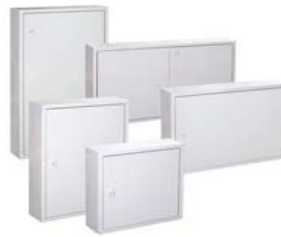
REGISTROS SECUNDARIOS DE SUPERFICIE IP33