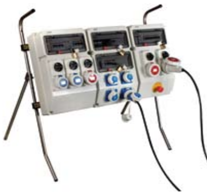
PLÁSTICOS SIN PROTECCIONES