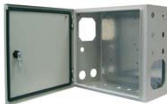
DIFERENTES TIPOS DE TROQUELES