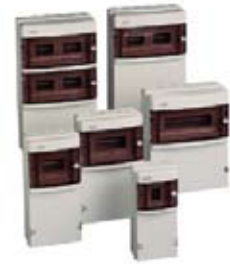
CAJAS PARA TOMAS DE CORRIENTE IP55