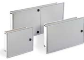
REGISTROS SECUNDARIOS DE EMPOTRAR IP33