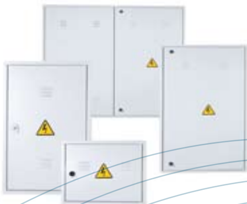
REGISTROS PARA HORNACINAS

Los registros metálicos para hornacinas están preparados para ser instalados en los nichos de obra y hornacinas prefabricadas, destinadas a alojar en su interior las cajas generales de protección y las cajas generales de protección y medida.