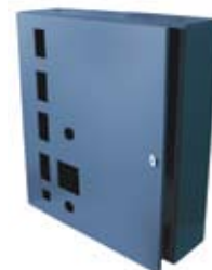
TABLEROS DE COLORES

El diseño y fabricación de esta línea de productos es lo suficientemente flexible como para adaptarse a ejecuciones especiales que requieran dimensiones concretas; tamaños, formas, troqueles, colores, que se adecuan a las necesidades de cada instalación y de sus proyectos especiales.