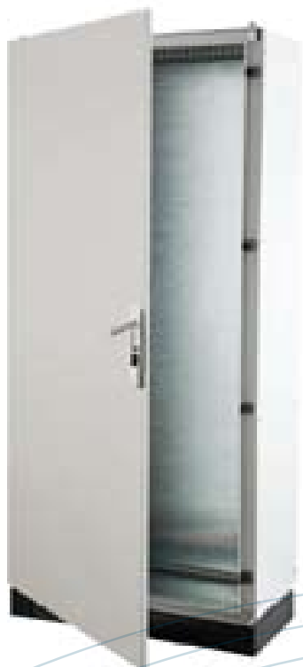
ARMARIOS METÁLICOS DE DISTRIBUCIÓN IP40-IP55