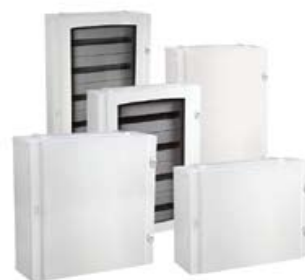
ARMARIOS COMBINABLES MONTADOS IP55

La gama de armarios metálicos de ide está formada por un conjunto de envolventes destinados a alojar en su interior la aparatma y equipamiento eléctrico necesarios para la alimentación, distribución y conversión de la energía eléctrica.