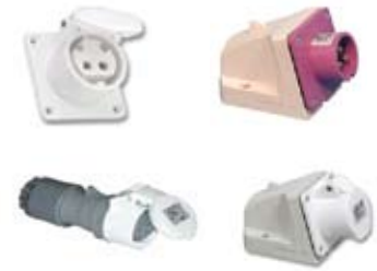
BAJÍSIMA TENSIÓN IP44

Las bases y clavijas de la serie Mundial están fabricadas de acuerdo a las normas EN60309-1 y EN60309-2., con materiales plásticos libres de halógenos de alta durabilidad, estando disponibles en un rango de 10 a 125 amperios y de 24 a 500 voltios.