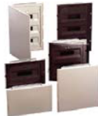
CAJAS PARA PAREDES HUECAS IP30